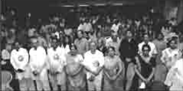
પંદે માતરમ્ ગાન ને સન્માન આપતા ઉપસ્થિત જ્ઞાતિજનો