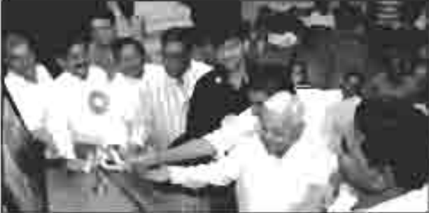
ભારતમાતા સમક્ષ દિપ પ્રાગટ્ય કરતા મહાનુભાવો